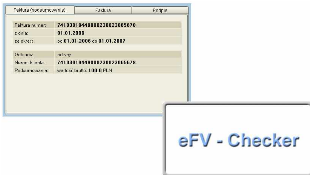
Rys.1 Aplikacja eChecker

Drugi ekran (Rys.2), „Faktura”, daje możliwość zapisania pliku PDF faktury, jak również jej danych (format XML) i podpisu na dysku twardego komputera.